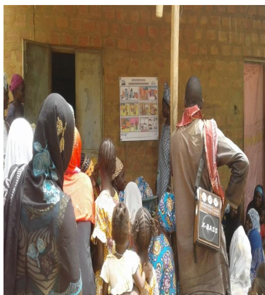
Restitution aux femmes de Bounguel (CAP de Sofara)