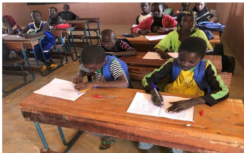
Evaluation centre SSA/P de Gouthine (CAP de Wabaria)