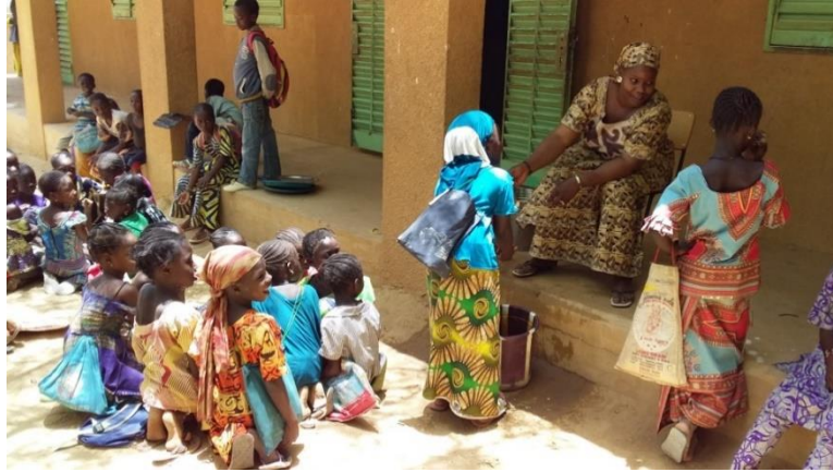
Photo : Lavage des mains avec l'appui d'une enseignante d'école de Madiama A. juste avant le repas chauds servis aux élèves.