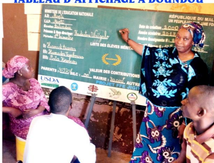
TABLEAU D'AFFICHAGE A DOUNDOU