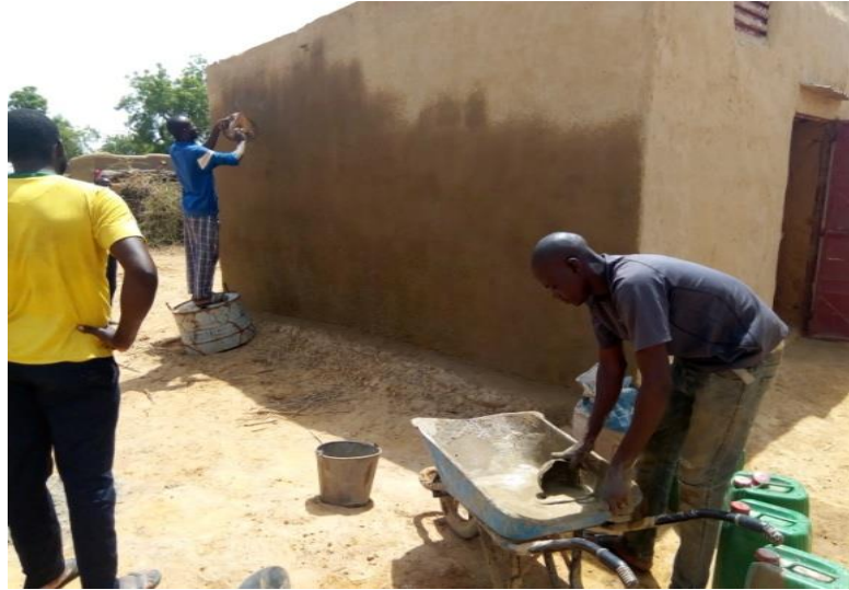
Photo : Finition travaux construction cuisine de Soguina

Autres constructions réalisées : les membres CGS de Soguina ont construit deux bâtiments de 2 blocs pour les logements de 2 enseignants avec toiture en tôles et cimenté. Ces travaux ont été réalisés grâce à la sensibilisation et la mobilisation communautaire autour des activités de l'école.