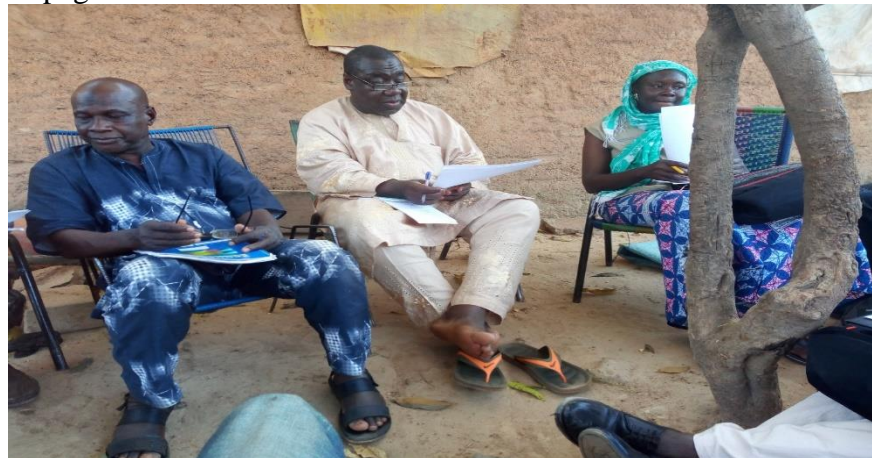
Supervision du Direction AMPRODE/SAHEL à Bougouni le 15/01/2019