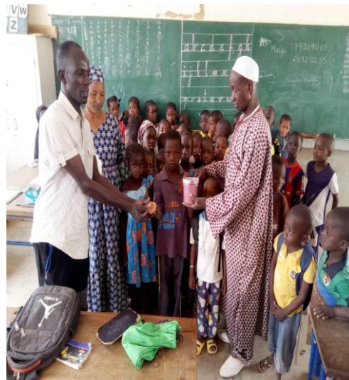
Photo : Administration de la vitamine A et d'Albendazole aux élèves de l'école de Sofara par l'agent de Santé en présence de la Directrice d'école du président CGS