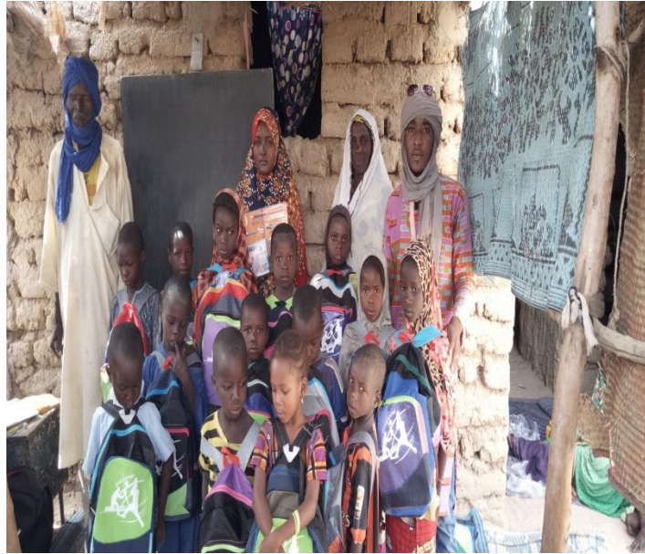
Ecole coranique de Tacharane